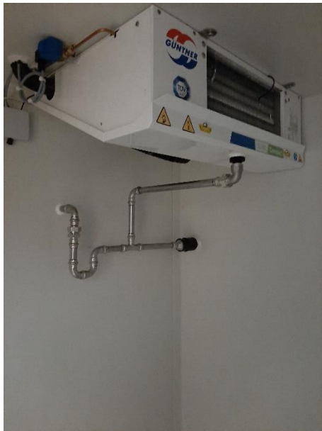
Kleines; Kühlanlage im Frigor

Die Vorfreude steigt. Jeden Tag sehen wir, wie Kleines und Grosses fertig gestellt wird und wir können waschen, putzen, einräumen, umräumen und schon bald die Möbel wieder aus den kleinen Ställen und der Kapelle ins Haus holen. Aber seht selbst! 😊