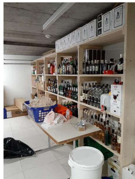
Um- und Einräumen mit viel Elan 😊