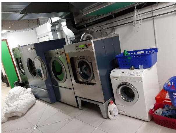
Waschen mit David und Goliath 😊